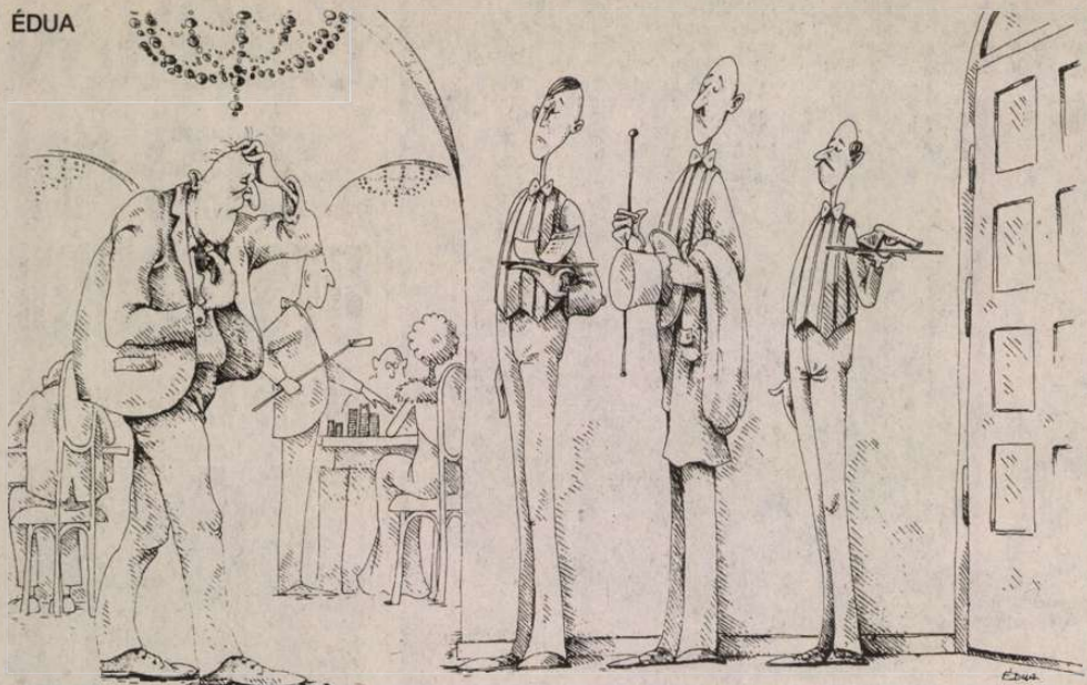
Osztályon felüli kiszolgálás